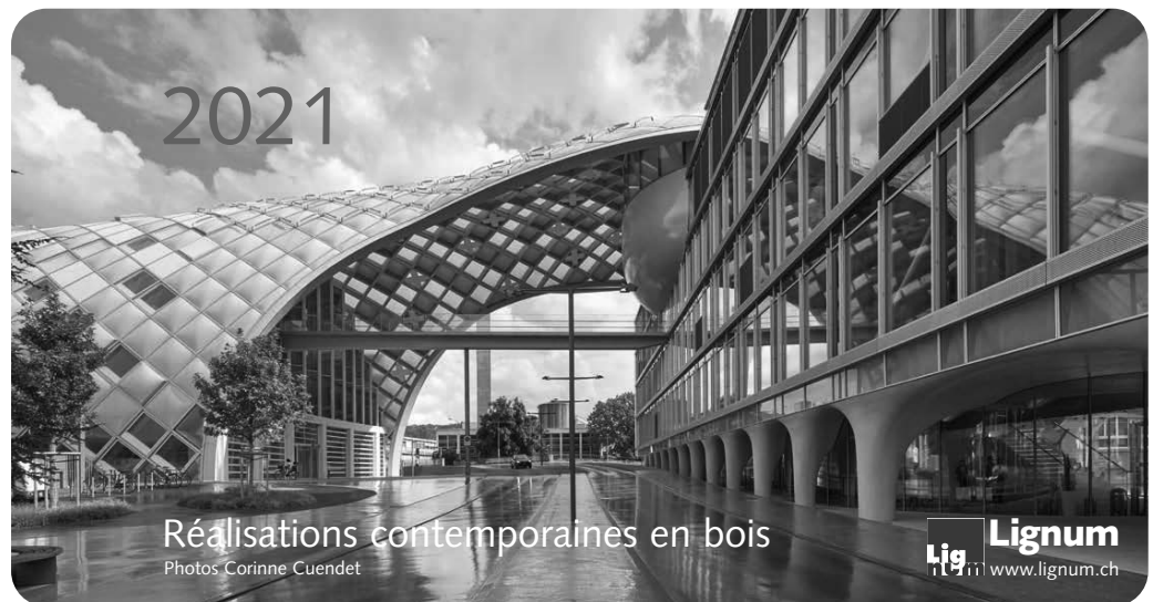
Calendrier réalisée en 2020 pour l'année 2021

Lignum Vaud a soutenu la publication de deux nouvelles brochures de la collection des brochures thématiques format A5. En juin paraissait un nouveau numéro intitulé Construction bois - Surélévation – Densifier vers l'intérieur. En décembre paraissait le numéro Structures originales – Diversité, systèmes et technologies. Ces brochures promotionnelles illustrent une série d'exemples construits et sont précédés d'une partie de vulgarisation théorique. Très utiles pour les différentes tâches de promotion et les manifestations de Lignum Vaud, elles peuvent être commandées et consultées gratuitement sous lignum.ch/fr/shop/brochures . Cette série de publications très appréciée est éditée par l'Office romand de Lignum avec le soutien de l'Office fédéral de l'environnement depuis plus de 15 ans.